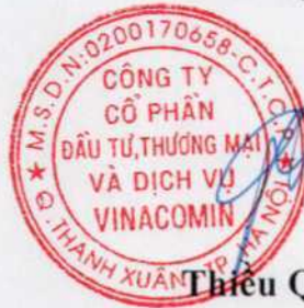
Thiều Quang Thảo