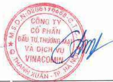
ĐỖ ĐỨC TRỊNH