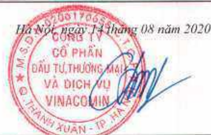
ĐỖ ĐỨC TRỊNH