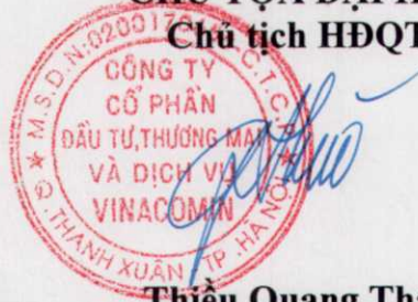
Thiều Quang Thảo