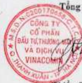
Thiều Quang Thảo