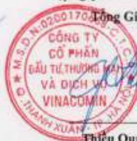
Thiều Quang Thảo