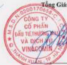
Thiều Quang Thảo