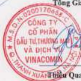
Thiều Quang Thảo