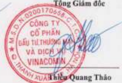
Thiều Quang Thảo