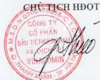
Thiều Quang Thảo