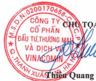
Thiều Quang Thảo